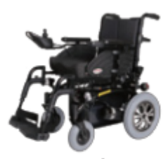
●ウェットブラック